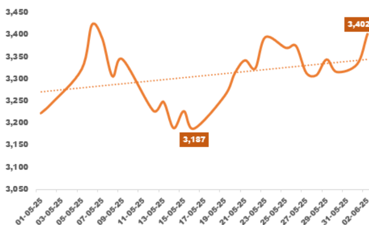
Figura 2: Precio del oro (por onza troy en USD)

Hablar de minería ilegal es relacionarlo mucho con el oro ilegal, dado que este mineral concentra la mayor parte de la minería informal e ilegal, debido a su fácil extracción utilizando métodos rudimentarios que no sucede con otros minerales que requieren grandes inversiones en infraestructura. Además, este mineral tiene un alto valor en el mercado internacional por lo que genera incentivos a los informales para continuar con su extracción. Actualmente, el gramo de oro se cotiza alrededor de 412 soles y como muestra la Figura 2 en los primeros días de junio se ha llegado a cotizar a 3,402 USD la onza.