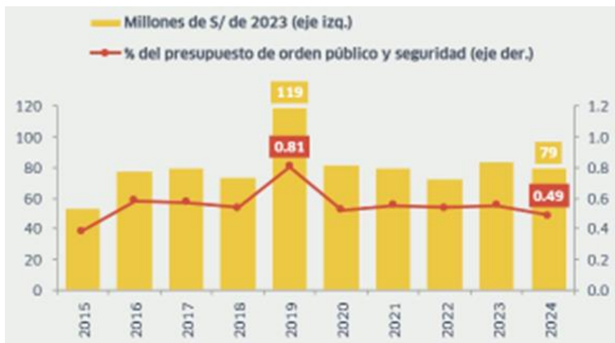
Figura 5: Presupuesto del programa “Reducción de la minería ilegal”, 2015-2024

Fuente: MEF-SIAF (2024), elaborado por el IPE.