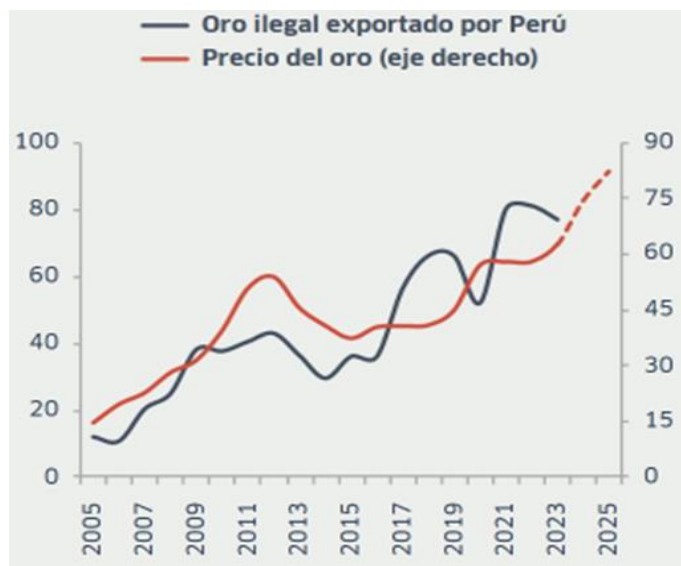
Figura 3: Estimado de oro ilegal exportado por Perú (toneladas y US$ por gramo)